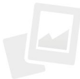
IMMAGINE NON DISPONIBILE